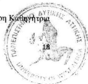
Αντιγόνη Σαραντάκη, Επίκουρη Καθηγήτρια